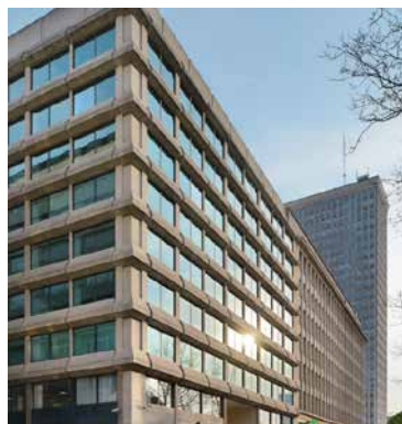
13-17 Marnixlaan 1000 Bruxelles – Belgique

La distribution du trimestre s'établit à 2,70 € par part en phase avec l'objectif de distribution prévu pour 2019 de 10,80 € par part (2,70 € par part par trimestre et ajustement le dernier trimestre en fonction du résultat 2019 et du prévisionnel de l'année suivante).