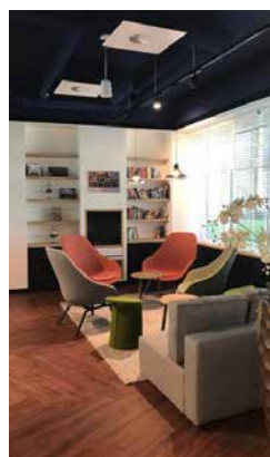
41-63 Neptunusstraat Hoofddorp – Pays Bas